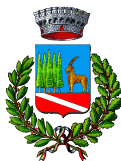
Comune di Pré-Saint-Didier