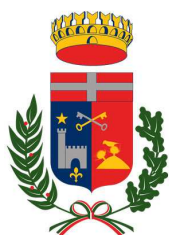
Comune di La Salle

Sulla sinistra orografica, attraversando il vigneto più alto d'Europa, sempre con la vista del Monte Bianco, si prosegue in direzione Pré-Saint-Didier (slm 1000 mt) con passaggio in prossimità delle rinomate terme (giro di boa). Passando poi sulla destra orografica si imbecca un divertentissimo single track con passaggio nel bike park del campeggio Camping du Parc. Usciti dal bike park si affrontano circa 5 km in piano fino a Morgex prima di risalire sull'ultima salita di 8 km, molto