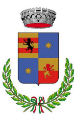
Comune di Morgex